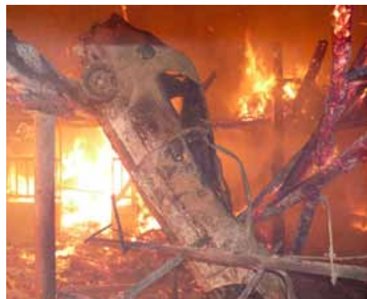
Feu de hangar agricole - Andouque - Février 2012

18/02/2012 - Mazamet : feu de stockage de 200 m 3 de charbon broyé dans une usine désaffectée. 2 victimes évacuées. 4 personnes au chômage technique